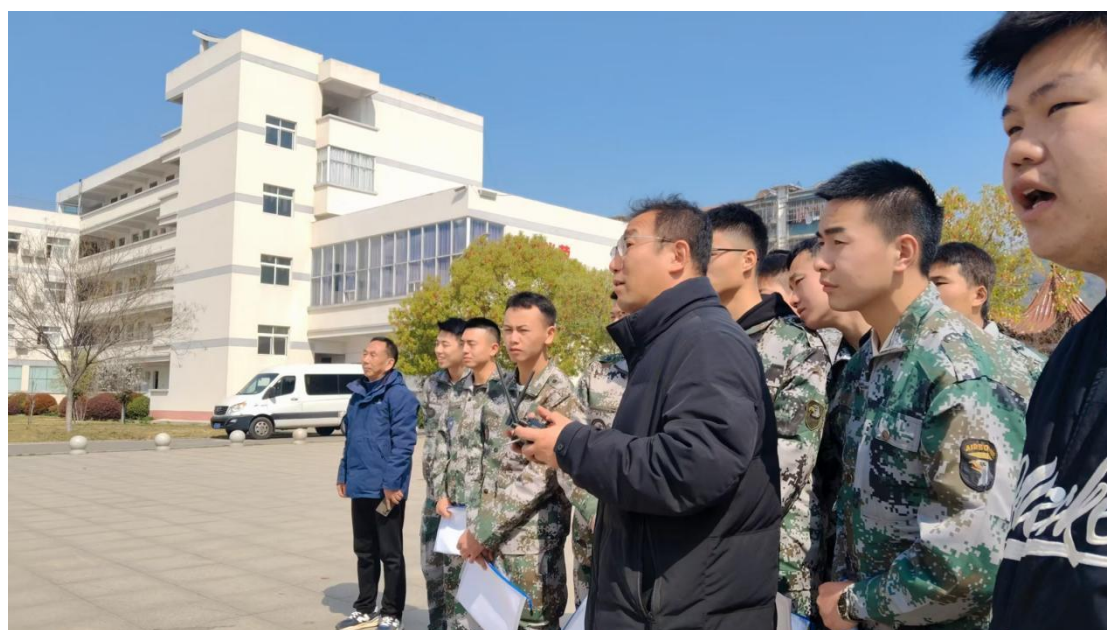
图 1-3-2 退役军人无人机操作技术培训

2025 年，学校与桐城市退役军人事务管理局合作，利用学校场地和教学资源，聘请专家开展退役军人无人机操作技术培训，为退役军人再就业提供技术技能支撑。