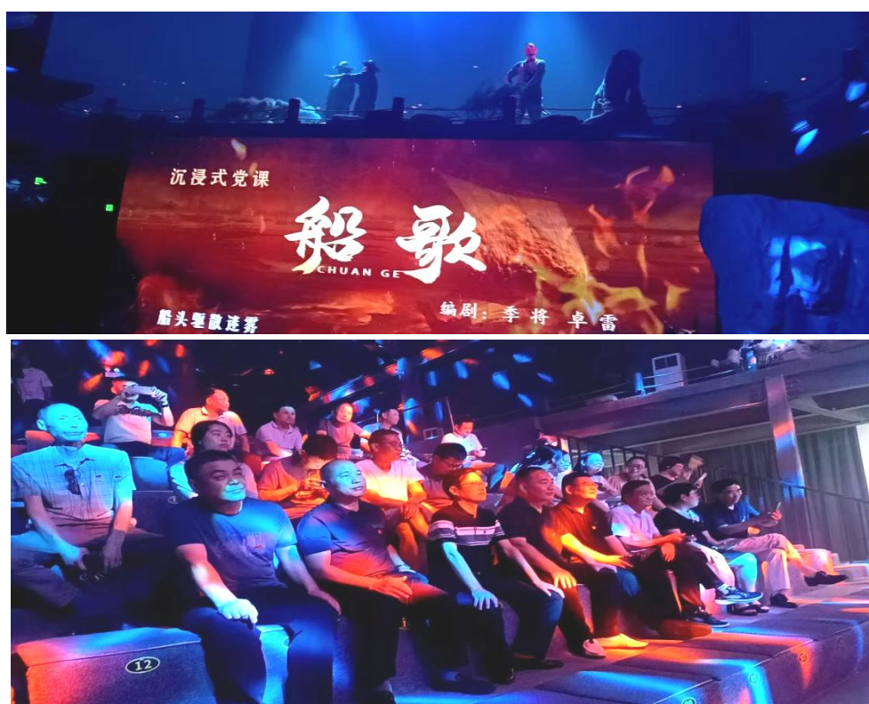
图 1-7-4 党员到六尺巷景区秋白剧场观看《船歌》