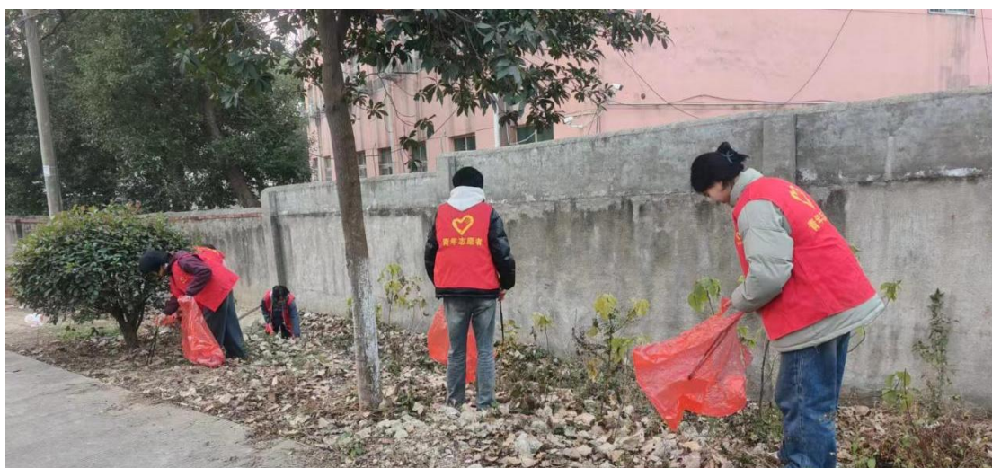
图 1-4-1 学生志愿服务