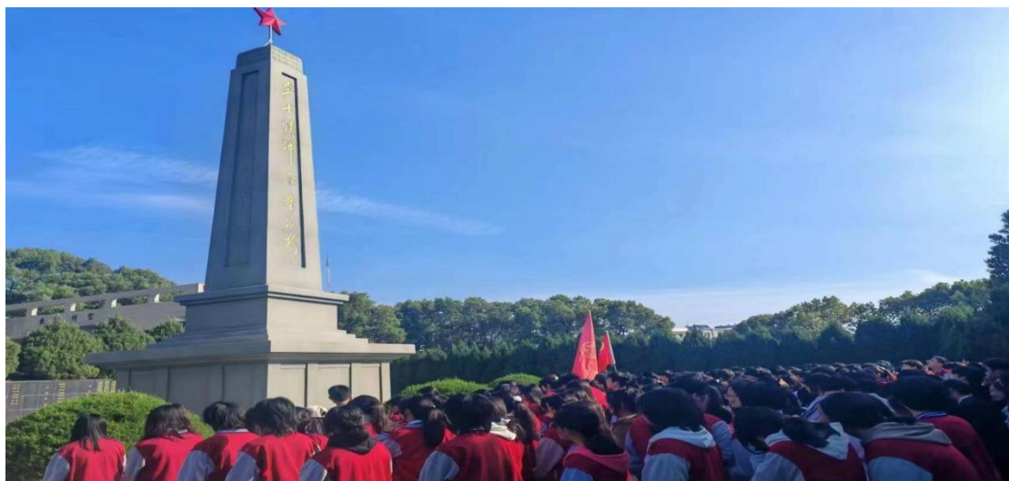
图 1-4-2 “祭英烈” 活动