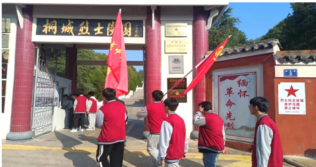
图 1-2-24 祭扫烈士墓

智育平台重水平重质量。实施分层教学，教学中尊重学生个体差异，对学生因材施教，充分发挥典型榜样引领作用。对智残等特殊学生组织学生志愿者重点关注，确保安全，保障特殊群体学生受教育的权利，不让一个学生因贫因病辍学。