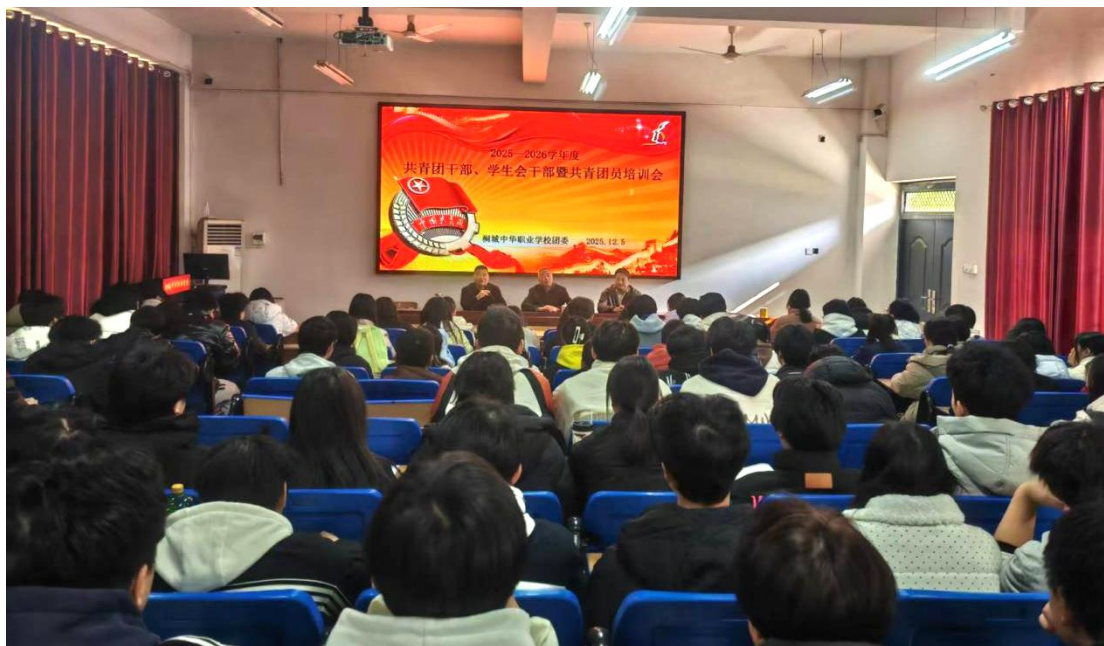
图 1-7-6 学生干部培训

讲座主要从理想、奋斗、协作三个方面，结合老一辈革命家的具体事例，深刻阐述了新时代青年成长成才的根本遵循和行动指南，勉励学生干部坚守理想信念，志存高远，为强国建设积蓄力量；希望他们担当作为、拒绝平庸，在职业教育领域创造出别样的精彩；要求他们牢固树立团结协作意识，在团队中充分发挥示范带头作用，进德修业，做新时代好青年。培训主旨明确，内容深入浅出，与会学生收获颇多，增强了他们励志成人成才、加强自我管理的责任意识和紧迫感。