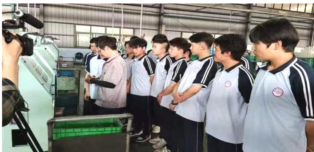
图 1-3-1 在 2025 年永生机械企业就业的毕业生

开展校企合作，是专业快速发展，提高办学综合实力的重要举措，是加强师资队伍建设，培养高素质高技能人才的重要途径。学校在深化教育教学改革中，坚持以服务为宗旨，以就业为导向的办学方针，积极探索“校企合作，工学结合”的人才培养模式，扎实推进校企合作，并取得初步成效。专业课教师与中小微企业技术骨干密切合作，推动技术研发和产品升级，助力地方产业转型升级。学生在校读书毕业后，基本上都能取得技能等级证书和职业资格证书，部分学生选择进入高校继续深造，其余学生直接在经济发达地区或本地就业，用人单位满意度高。