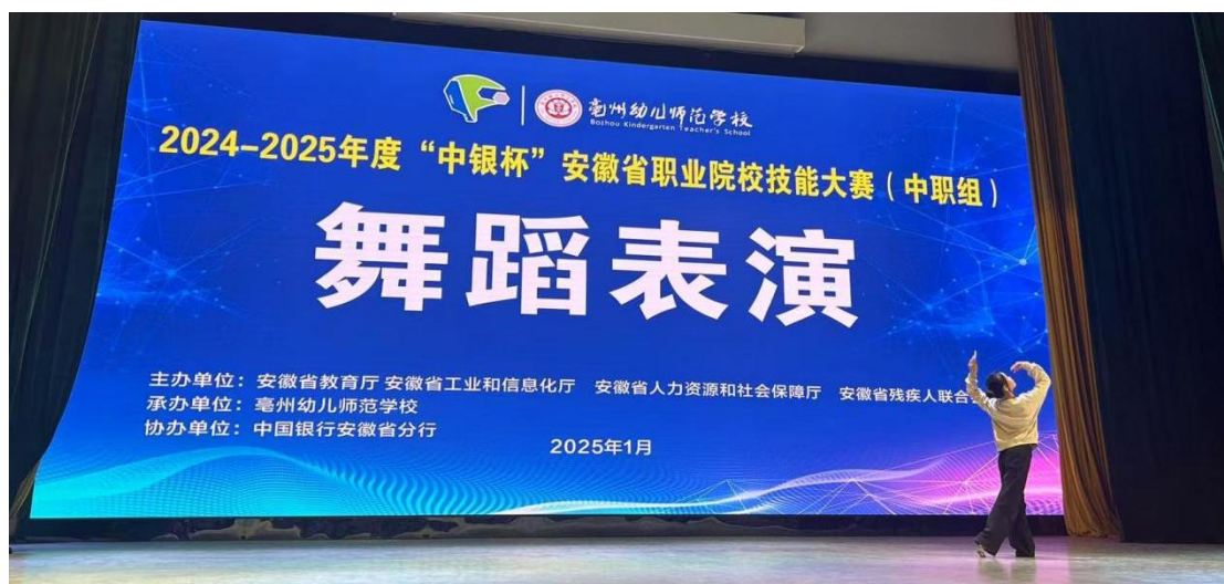
图 1-2-5 学生参加省级技能大赛