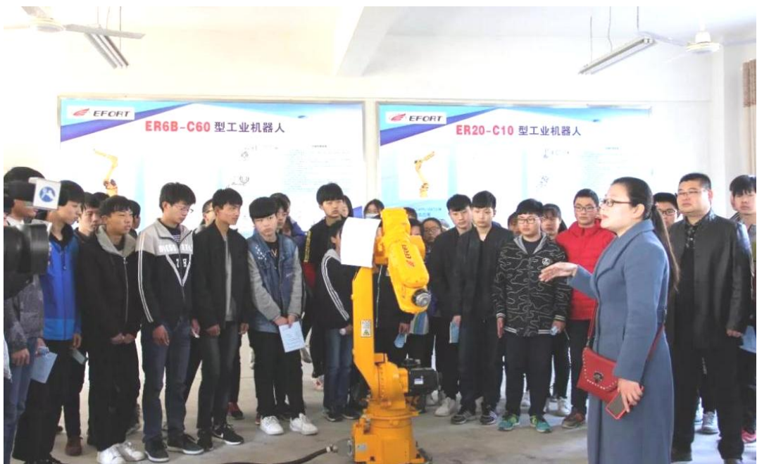
图 1-6-4 校企合作学生实习