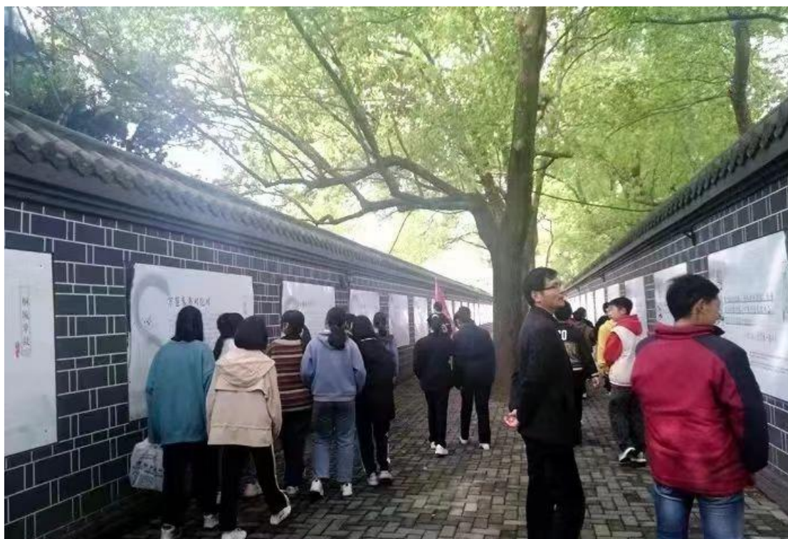
图 1-4-3 学生参观六尺巷景区