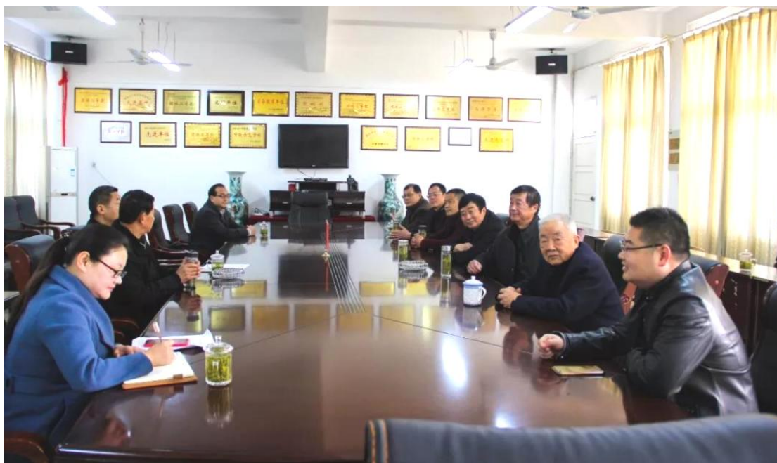
图 1-6-3 校企合作双方协商