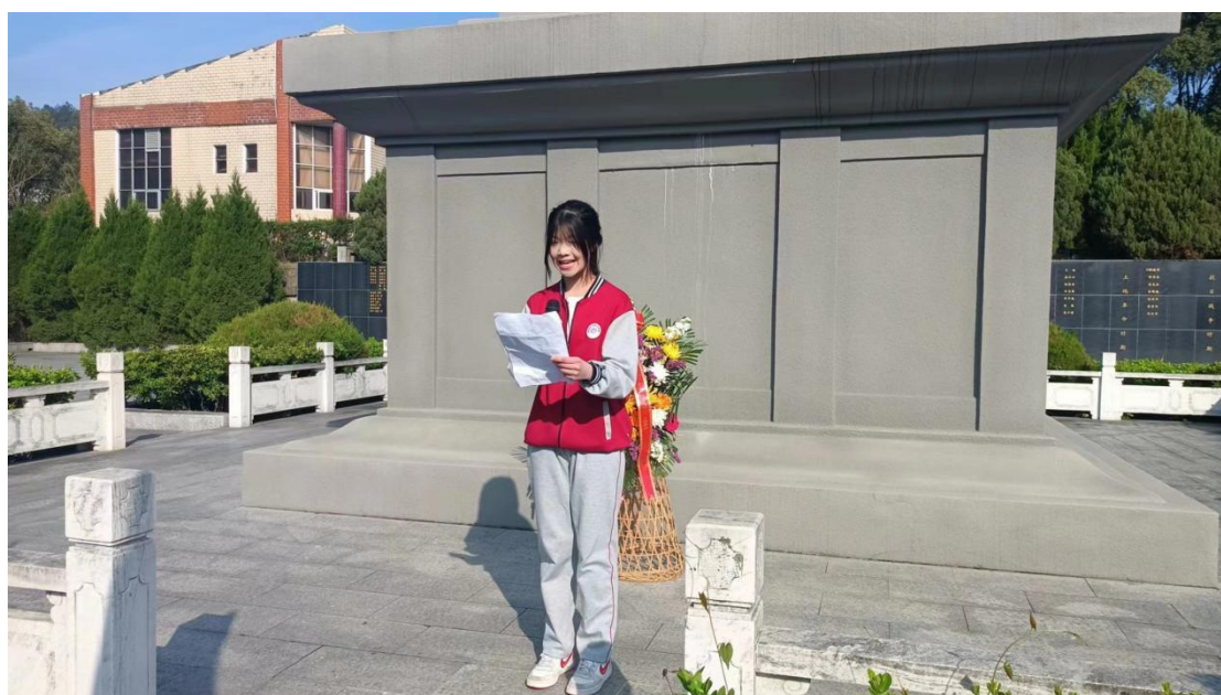
图 1-4-8 学生代表发言

学生代表发言，向革命烈士表达无限的敬意和无尽的哀思，抒发了新一代的青少年继承先烈遗志、传承红色基因，用先辈们的精神力量激励自己，树立理想并为之奋斗的坚定信念。