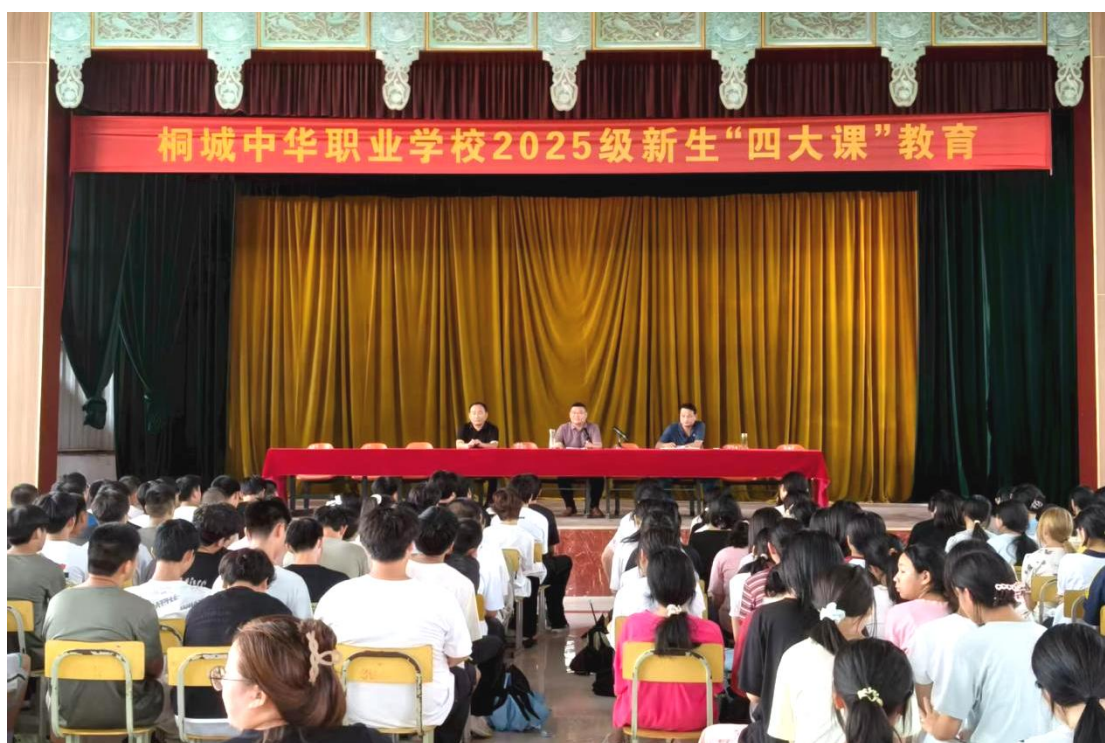
图 1-1-1 四大课教育——校史教育

个方面入手，让学生明白人是要有精神的，桐城中华职业学校白手起家，负重前行，屡创辉煌，源于全体师生倾情奉献和坚韧执着。