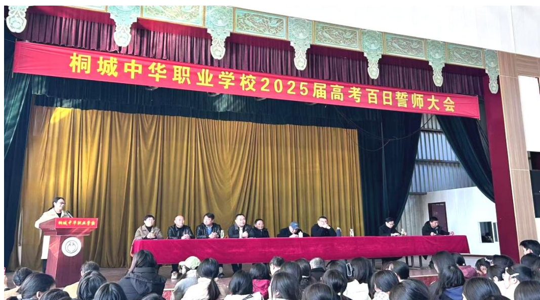
图 1-2-21 高三班主任代表汪海林发言

学生集体宣誓，喊出了决战高考的青春誓言。他们的誓言铿锵有力，充满了对高考的宣战和对青春的自信。