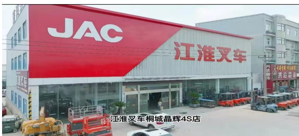
图 1-2-12 晶辉 4S 店外景

方辉，桐城中华职业学校 2006 届毕业生，汽车制造与检测专业毕业，大专学历，2008 年开始从事叉车销售业务。2020 年创建江淮叉车桐城晶辉 4S 店，占地 7 亩，建筑面积 3000 平米，集整机销售、租赁、零部件供应及维修服务等功能于一体，产品销售量占桐城区域 70% 以上，广泛应用于印刷包装、羽绒家纺、智能制造等行业，取得了良好的经济效益和社会效益。