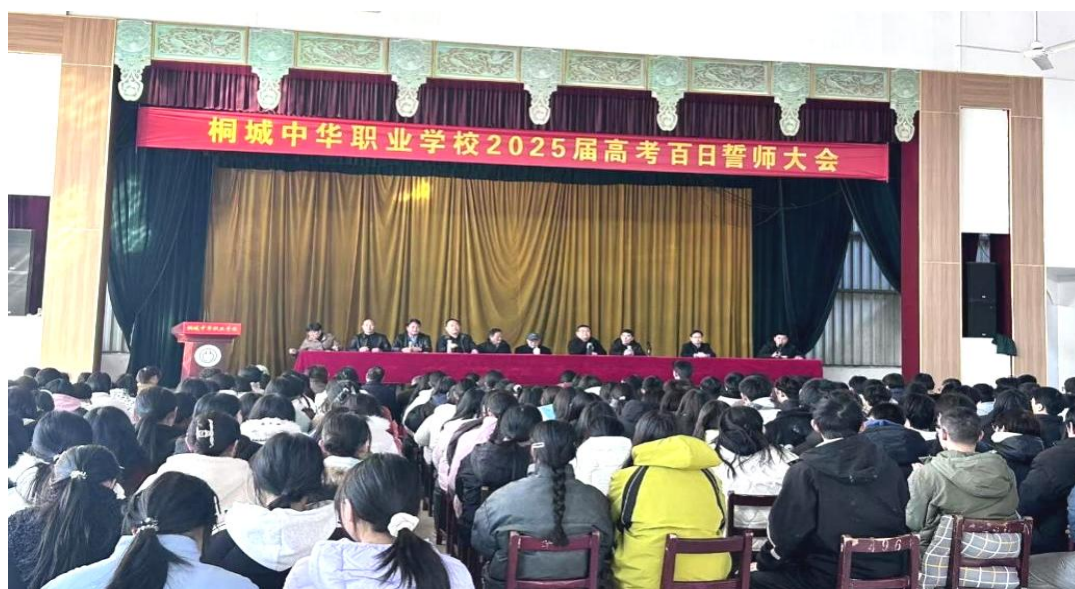
图 1-2-20 徐雄强校长作高考百日誓师大会动员报告

成立毕业班工作领导小组，扎实抓好常规教学与复习，着力提升职业高考成绩。组织高三全体师生隆重举行高考冲刺百日誓师大会，为高三学子加油助威，就是学校职业高考成绩长盛不衰的重要环节。