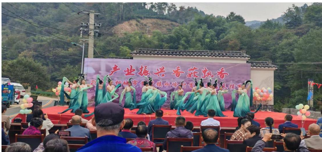
图 1-3-4 为桐城市“产业振兴香菇飘香”香菇采摘节演出