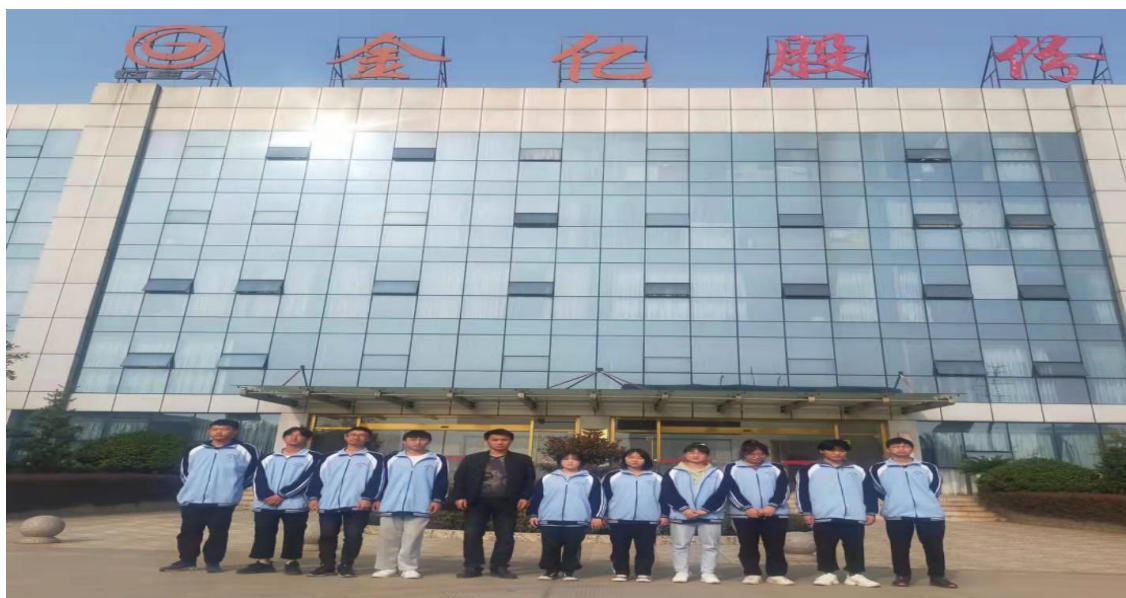
图 1-2-19 实习学生代表与指导教师合影