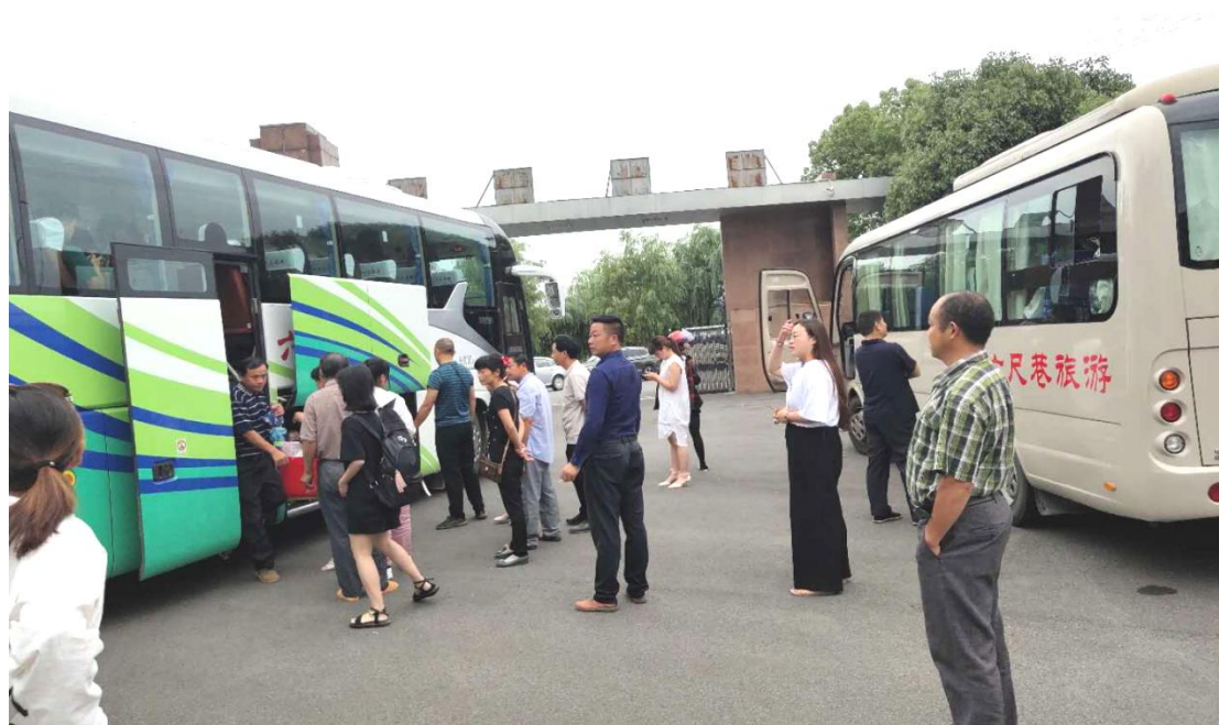
图 1-2-18 送学生到企业实习