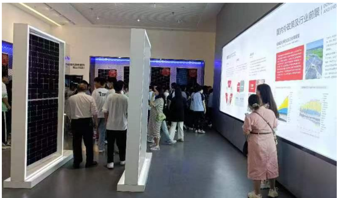
图 1-6-1 学生在企业实习