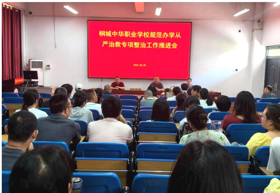
图 1-7-1 推进规范办学从严治教专项整治

动，结合区域内某学校教师滥订课外辅导资料吃回扣的问题，以案示警，要求全校教师将教育家精神内化于心、外化于行，提高品德素质，廉洁从教，着力推进学校内涵建设，办人民群众满意的中职教育，活动收效明显。