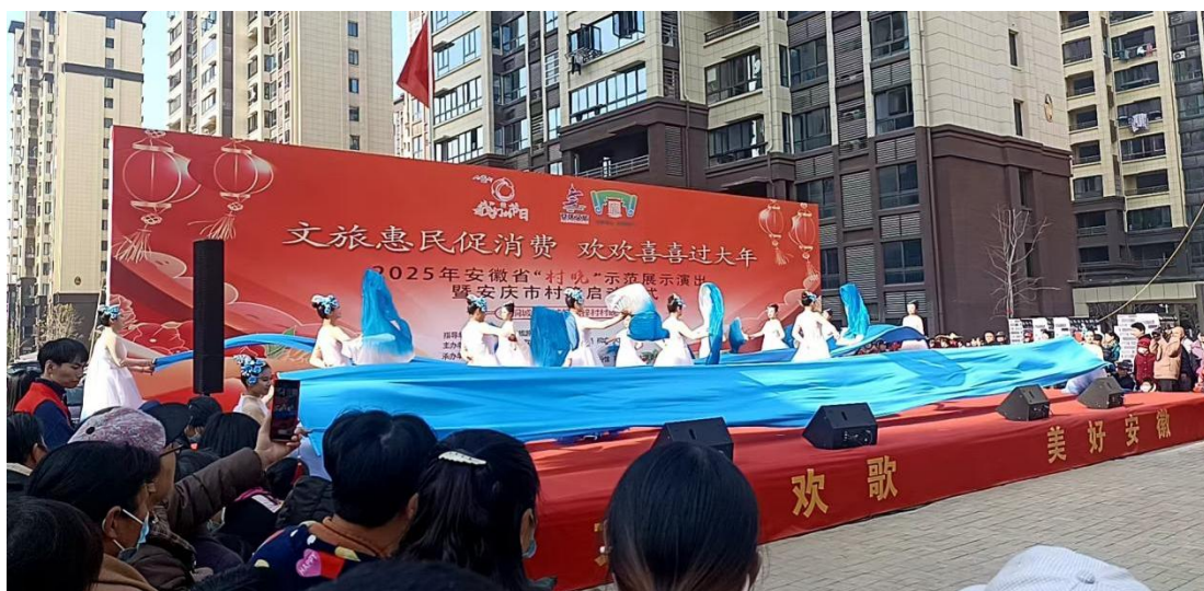
图 1-2-7 公益演出