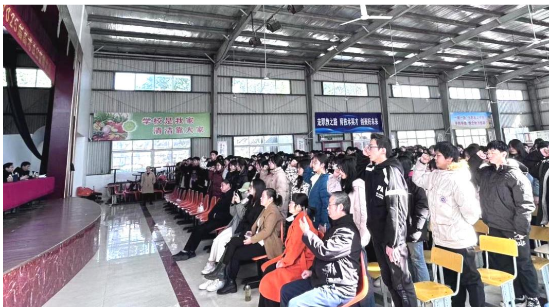
图 1-2-22 全体高三学生宣誓

学生集体宣誓，喊出了决战高考的青春誓言。他们的誓言铿锵有力，充满了对高考的宣战和对青春的自信。