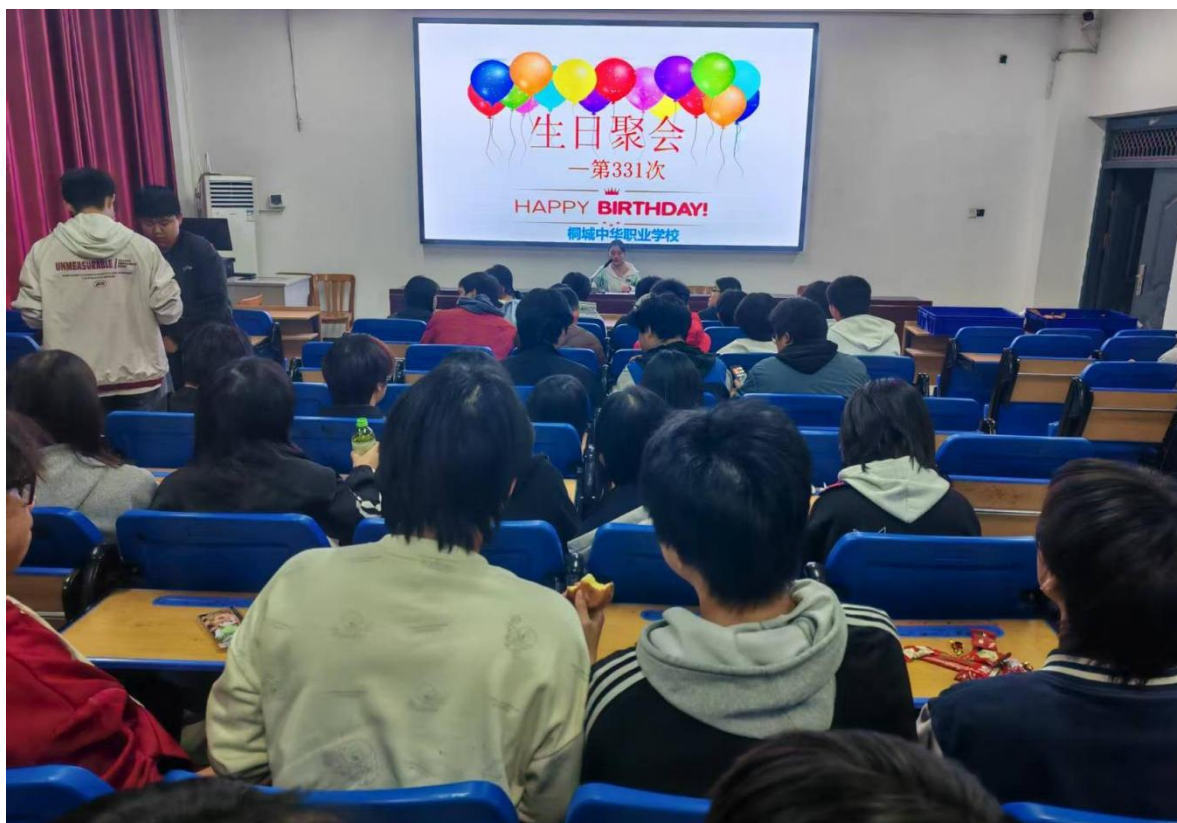
图 1-1-3 集体生日聚会