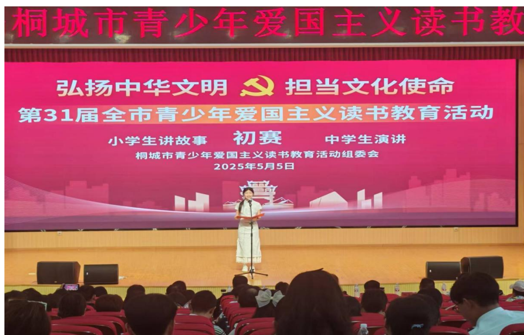
图 1-2-25 演讲比赛

智育平台重水平重质量。实施分层教学，教学中尊重学生个体差异，对学生因材施教，充分发挥典型榜样引领作用。对智残等特殊学生组织学生志愿者重点关注，确保安全，保障特殊群体学生受教育的权利，不让一个学生因贫因病辍学。