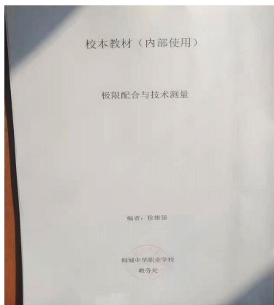
图 1-2-15 教师自编校本教材

学校教学用计算机共 385 台，其中学生用机 300 台，教师用机 85 台，满足在校师生的正常使用。学校推进智慧校园建设，现有网络服务提供商提供 2550M（中国电信 450M，中国移动 2100M）宽带的互联网接入服务，以保障全校信息化需求，并利用智慧校园平台管理全校信息系统，广泛运用计算机、大数据、移动互联网等新一代信息技术，开展线上线下混合式教学，探索“互联网+”智慧教学、管理、服务新模式。学校重视信息化教学，举办了教师教学能力比赛，展示了教师信息化教学的成果，得到了学校领导、行业企业专家的高度肯定，并积极参加安庆市、安徽省教师教学能力比赛。