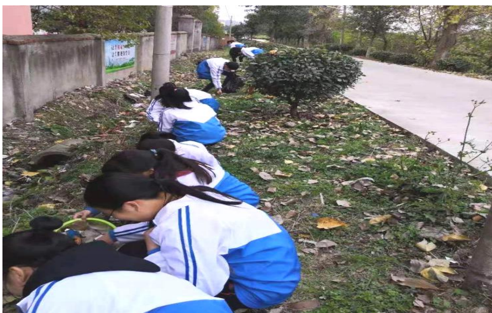
图 1-6-6 受助学生参加志愿服务

资助育人，还让众多受助学生心怀感恩，成立了志愿服务队伍，不定期开展环境整治等志愿服务活动，开展元旦汇演、桐城春晚、“桐城歌”非遗文化传承演出等公益活动，回馈社会。