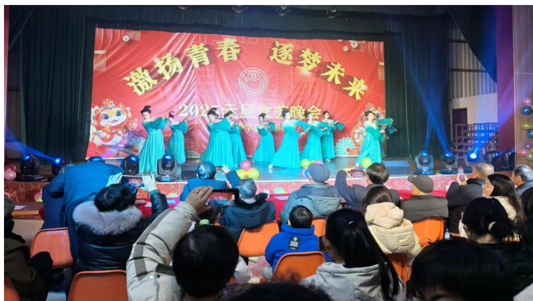
图 1-2-26 元旦迎新晚会

美育平台重普及重熏陶。利用学校师资优势，开展课外音乐、绘画、书法辅导，提高学生的艺术鉴赏能力。学校是安庆市国家级非遗项目“桐城歌”传承基地，成立了合唱团、舞蹈队，积极参加桐城春晚、地方剧种展演活动，举办校园艺术节、元旦大型迎新晚会等。