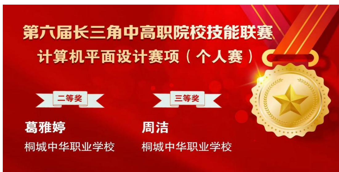
图 1-2-6 学生参加长三角中高职院校技能联赛