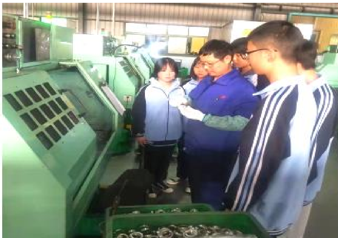
图 1-6-5 校企合作学生实训操作

展。为当地从业人员开展短期培训，提供技术支撑，提升了区域内行业整体技术水平，推动了地方经济发展。