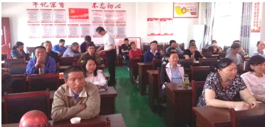
图 1-3-5 茶叶种植技术培训

通过远程在线、集中培训等形式开展培训项目，面向社会，免费公益，助力农村脱贫攻坚。2025 年，非学历培训项目数 8 个，包括茶叶种植与加工、机械加工、电子技术、驾驶技术、幼儿保育、无人机操作技术等，培训次数共 8 次，参加培训 2000 人次。非学历培训活动的开展，对促进城乡剩余劳动力转移、提高人民群众收入，起到了很好的推动作用。