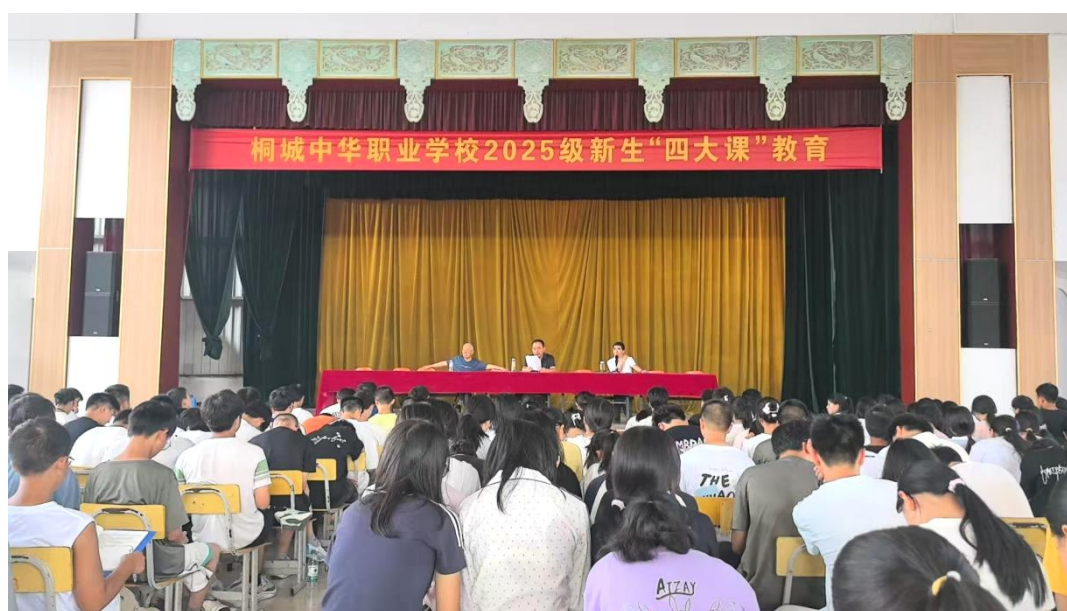
图 1-1-2 四大课教育——校训教育

“校训教育”，以“金的人格、铁的纪律”为主线，引导学生充分认识在知识、能力、品质三个方面，后者比前者更重要。