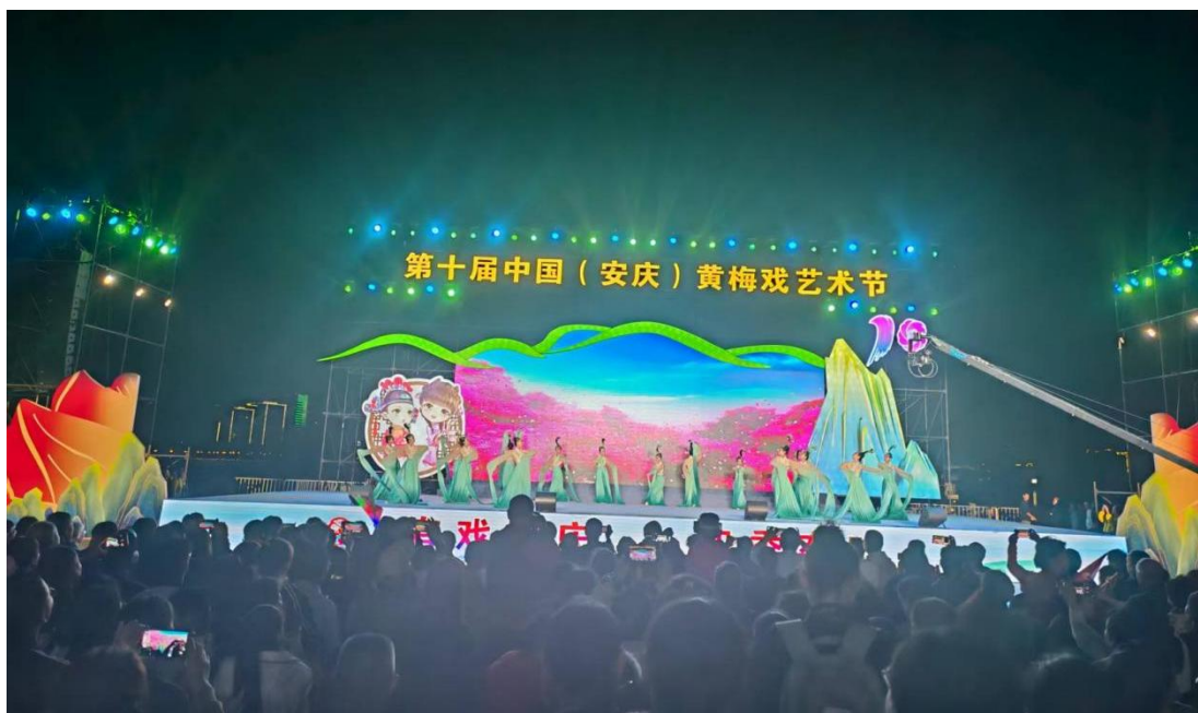
图 1-2-3 组织学生参加地方戏曲演出