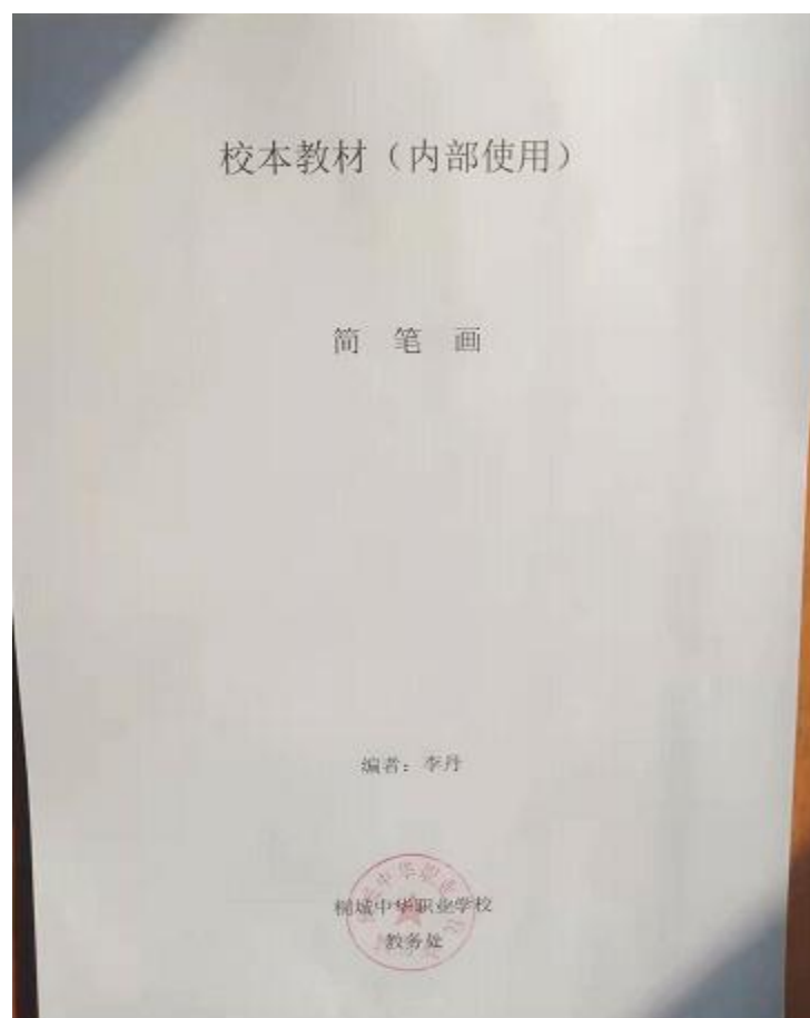
图 1-6-2 自编教材《简笔画》