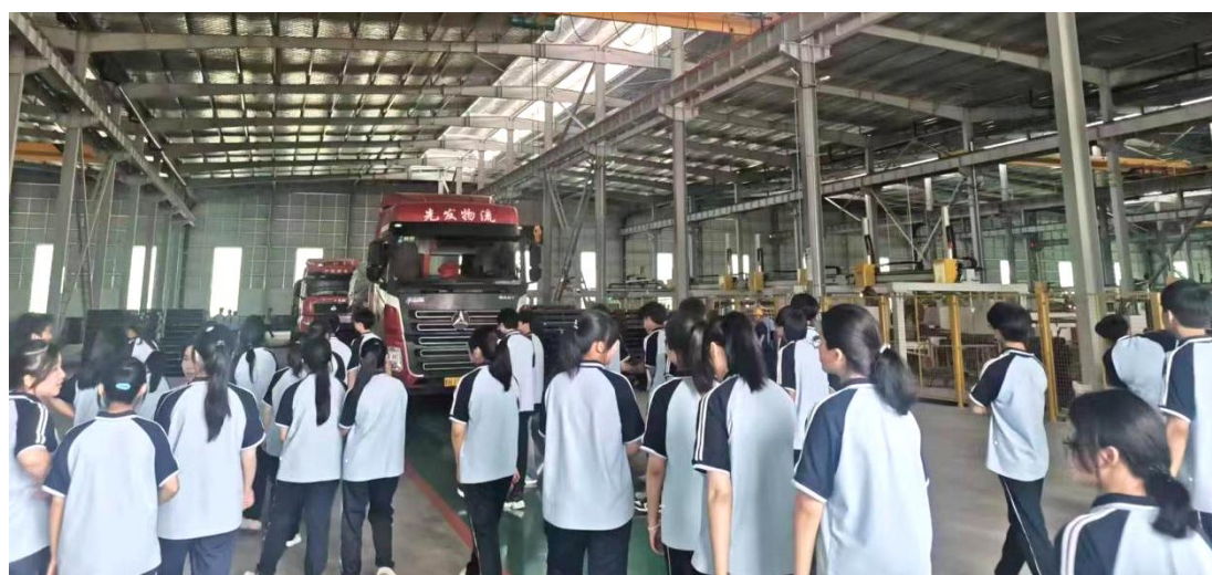
图 1-2-17 学生参观企业、感知企业文化

结合学生知识储备和兴趣爱好，学校选用的是省级规划教材，配以自编的校本教材，通过教师培养培训、提升“双师”素质及工作及成效等，教学、实训效果良好。