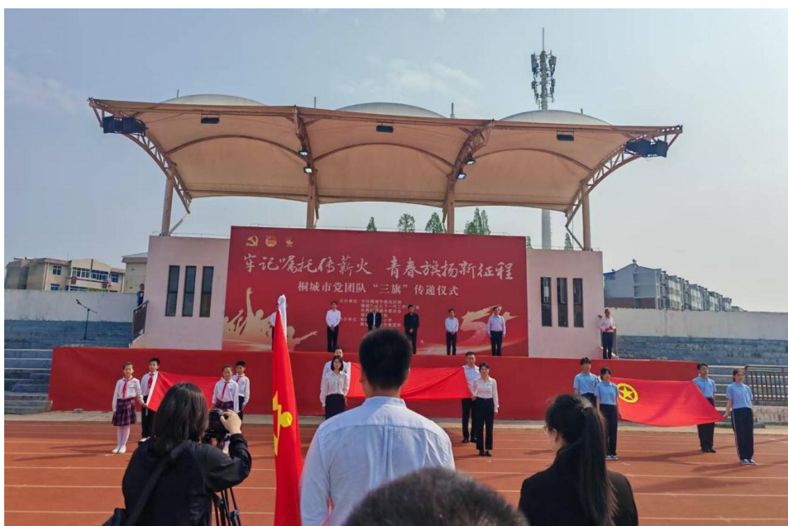
图 1-4-4 组织团员代表参加桐城市党团队“三旗”传递仪式