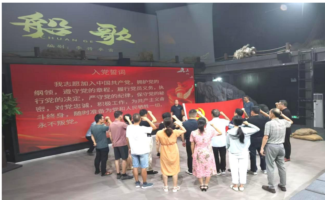
图 1-7-5 重温入党誓词

本次参观学习，让党员干部对六尺巷故事深厚的文化内涵和时代价值有了更清晰的认识，也让大家对“大事讲原则，小事讲风格”有了更深刻的体会。