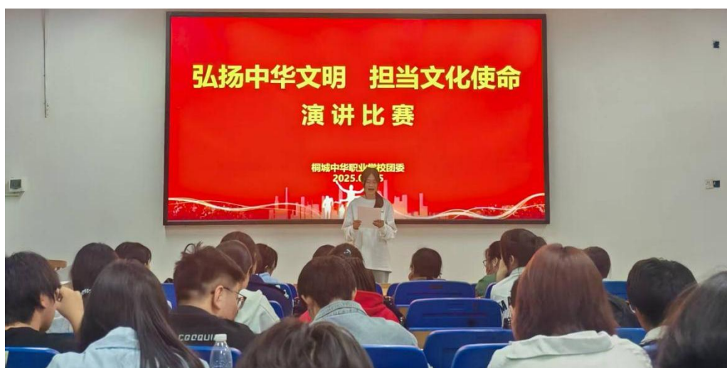
图 1-4-6 举办“弘扬中华文明，担当文化使命”演讲比赛

参赛选手个个精心准备，他们紧扣读书活动主题，或娓娓道来，或慷慨激昂地将一个个感动的、有趣的、耐人寻味的故事展现在大家的面前。他们用自己的方式，传递着对祖国的热爱之情，展现出新时代青年的风采。