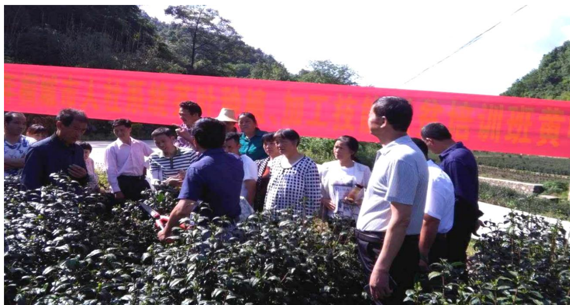
图 1-3-3 具体指导茶农茶叶种植养护

企业在开展企业员工、农村劳动力转移和社区居民技能培训方面紧密合作，为企业员工技能提升、产业转型升级和农村劳动力的就业再就业发挥应有的作用，为地方经济的发展作出新贡献。