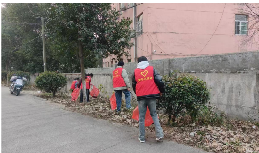
图 1-2-6 劳动教育——整治校园周边环境

培训学习，聘用高职院校高水平教师为学校兼职教师，不断优化专业设置、课程设置，改革培养模式，大力推行校企合作、产教融合，注重学生创新创业意识及技能培育，着力提高学生思维与动手能力，着力提高学生的全面职业素质，增强学生的就业与创新创业能力。