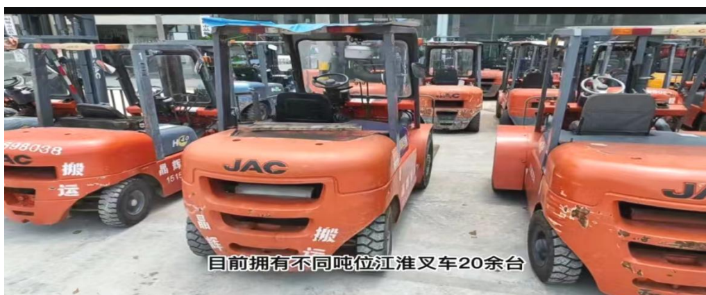
图 1-2-13 销售服务车间