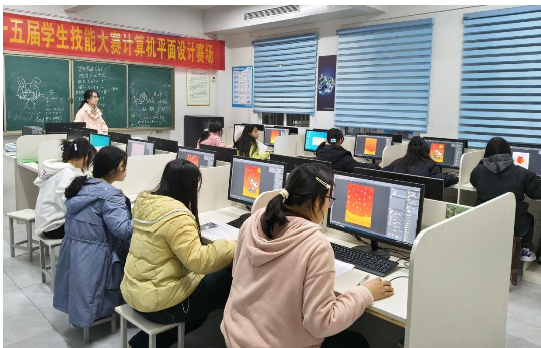
图 1-2-3 学生认真参赛

平时注重育训结合、以赛促教、以赛促学，不断提升技术技能人才培养质量，拓宽学生成长成才通道。每个年级开设 1 个职普融通班，高一开设普通高考文化课程。学生进入高二时在老师指导下，根据自己的学业水平及兴趣爱好选择职普分流，实现了分层教学、分类指导。为学生今后拥有更好的发展平台，学校非常重视职业高考，今年利用暑假义务为 60 名学生开展文化课培优课程，取得了良好的成效，在全校师生共同努力下，2025 年职教高考本科录取 23 人，在桐城市区域内继续领先。进一步拓展中高职一体化培养模式，与安徽机电职业技术学院深度合作，机电专业实现了 3+2 中高职衔接。