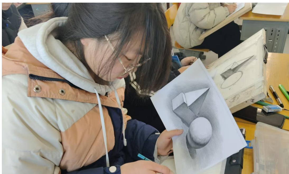
图 1-2-14 学生实训

校内实训基地建设不断推进，2025 年，生均校内实践工位数 0.61 个，生均教学仪器设备值 7562 元。