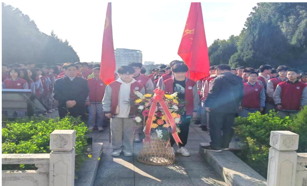
图 1-4-7 向革命烈士敬献花篮

学生代表发言，向革命烈士表达无限的敬意和无尽的哀思，抒发了新一代的青少年继承先烈遗志、传承红色基因，用先辈们的精神力量激励自己，树立理想并为之奋斗的坚定信念。