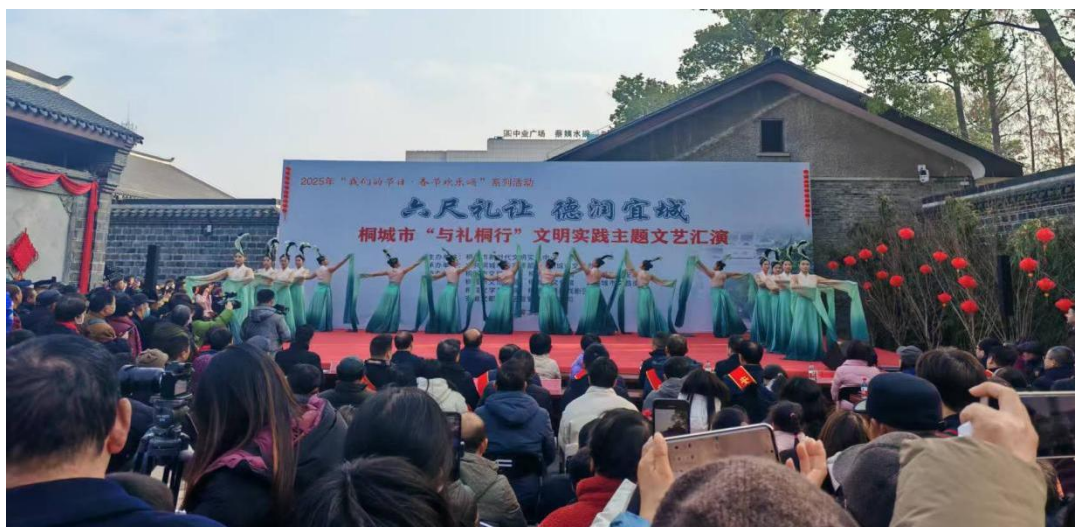
图 1-4-2 组织学生前往六尺巷参加主题文艺汇演

桐城中华职业学校是传承桐城国家级非遗项目《桐城歌》的定点学校，大型歌舞表演《桐城歌》成了每年元旦晚会的保留节目；依托专业优势，学校文艺社团活动开展异彩纷呈，黄梅戏经典作品从学校不断走向社区、走向乡村；开展参观学习、演讲比赛等活动，依托“六尺巷”文化，学校成立了心理咨询和矛盾调解组织，倡导宽容礼让，构建和谐校园。