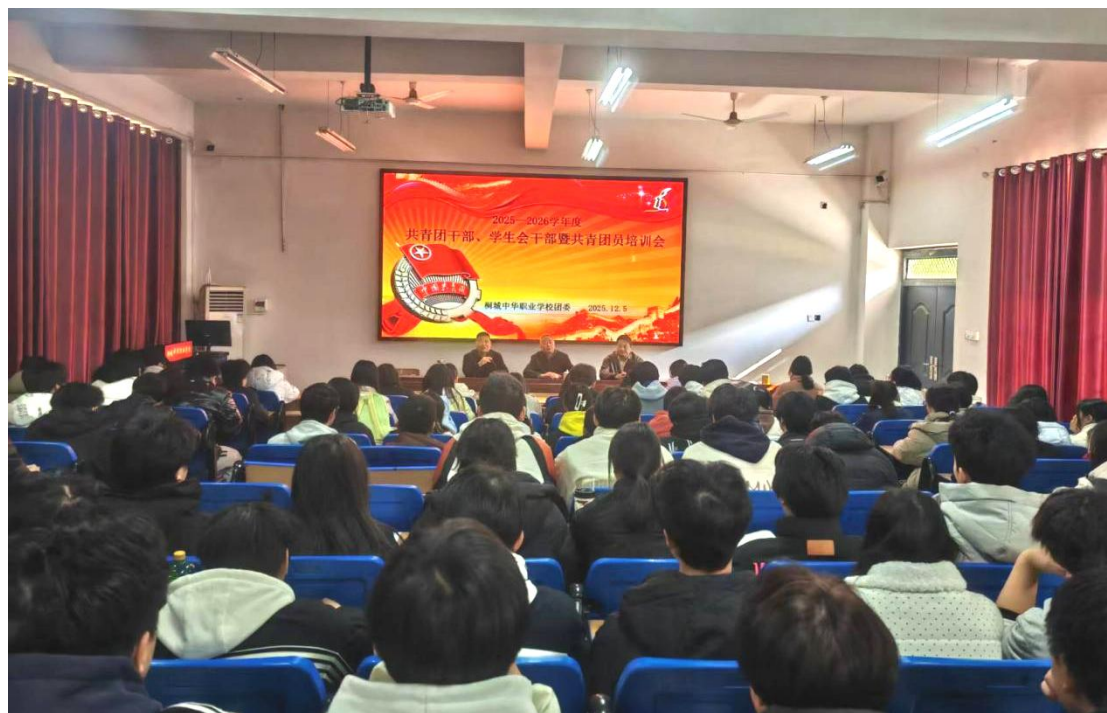
图 1-2-1 学生干部、共青团员培训

之志，成有用人才》教育主题讲座，全校共青团干部、学生会干部和共青团员聆听了讲座。与会学生收获颇多，增强了他们励志成人成才、加强自我管理的责任意识和紧迫感。