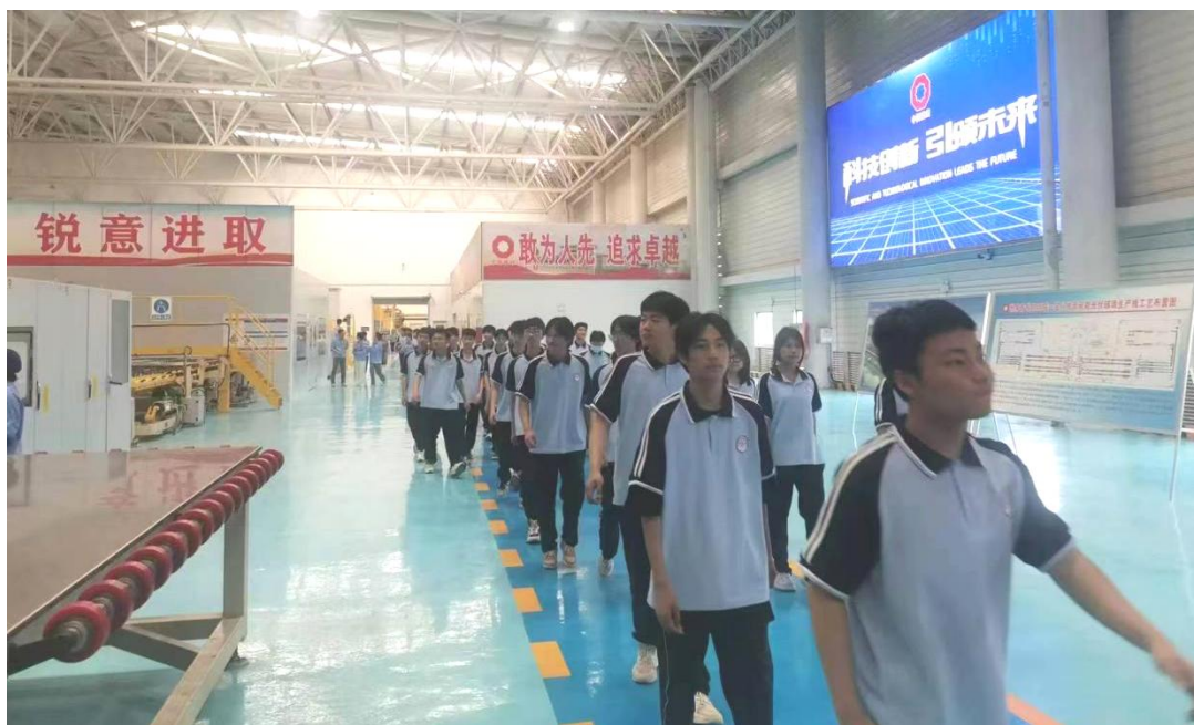
图 1-4-5 学生到企业参观学习

在“职教宣传周”等重点时段，对在校学生和初中应届毕业生开展职业启蒙（体验）教育。在校内开展解读国家职教政策、开展职教政策宣讲、举办以职教为主题的征文、演讲等活动，举办学校技能大赛检验平时训练成果，组织学生到企业参观学习，感知企业文化；深入各初中宣传国家职教政策和学校的办学优势，引导初中毕业生及家长正确认识职教的内涵，为秋季招生作准备。2025 年，学校开展职业教育的场次达 10 次，接受教育的学生达 2400 人以上。