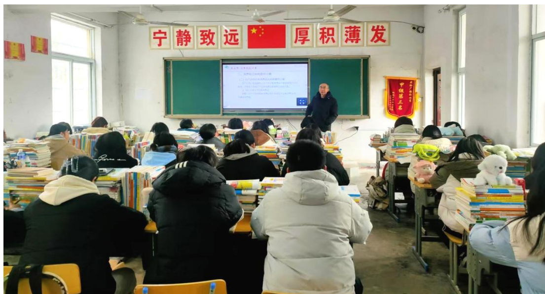
图 1-2-16 公开课教学